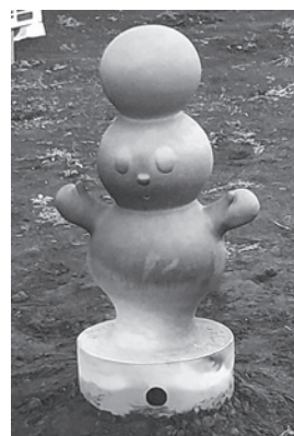
河明求さん作：ぽぽはにわ