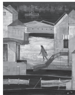
『冬日記』1996年（朝霞市博物館所蔵）